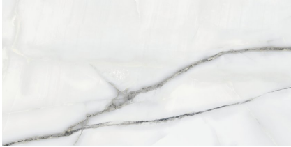
NEWBURY WHITE PULIDO P8016P