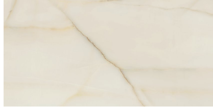
NEWBURY PULIDO P8016P